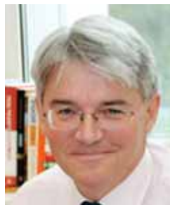
安德鲁·米歇尔 (Andrew Mitchell) (下院议员) 国际发展部大臣