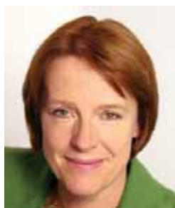
卡罗林·斯佩尔曼 (Caroline Spelman) (下院议员) 环境、食品及农村事务部大臣